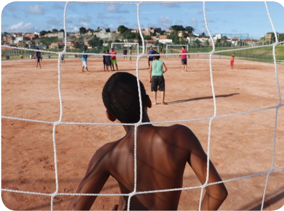
Jovens brincam em área de lazer alagável do Parque Rosa dos Ventos