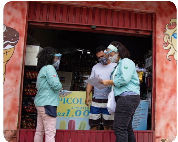
Mobilização para cadastro de empreendimentos