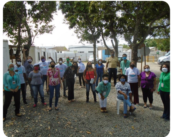
Equipe do PTS com facilitador e participantes da oficina