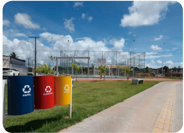
Lixeiras para coleta seletiva instaladas no Parque Rosa dos Ventos

As equipes do Consórcio Ipitanga, da Companhia de Desenvolvimento Urbano do Estado da Bahia (CONDER), da CAIXA e do Ministério do Desenvolvimento Regional (Governo Federal) desejam um feliz 2022 para todos os colaboradores e moradores das poligonais de intervenção do Projeto de Macrodrenagem dos rios Joanes e Ipitanga.