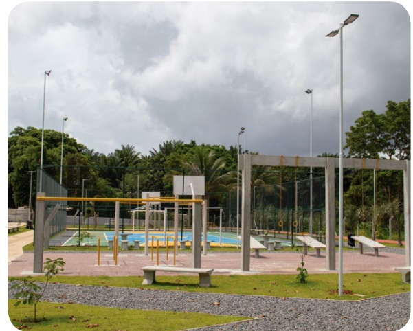
Opções de lazer para todas as idades