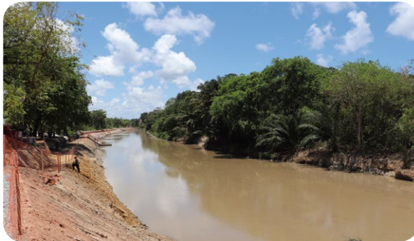
Desassoreamento do Rio Joanes, em Lauro de Freitas