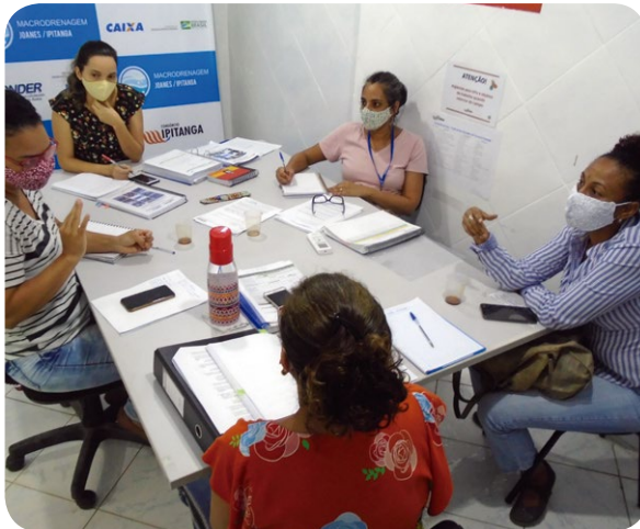
Reunião de alinhamento entre as equipes do social da CONDER e do Consórcio Ipitanga