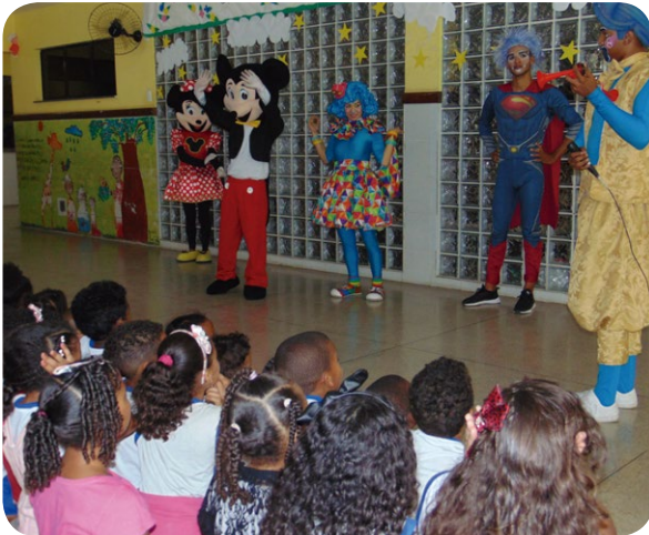
Mobilização com estudantes da rede pública de Salvador