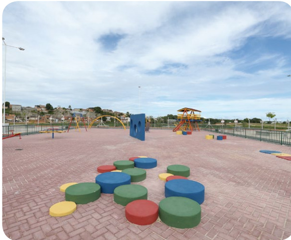
Parque infantil da área de lazer do Parque Rosa dos Ventos