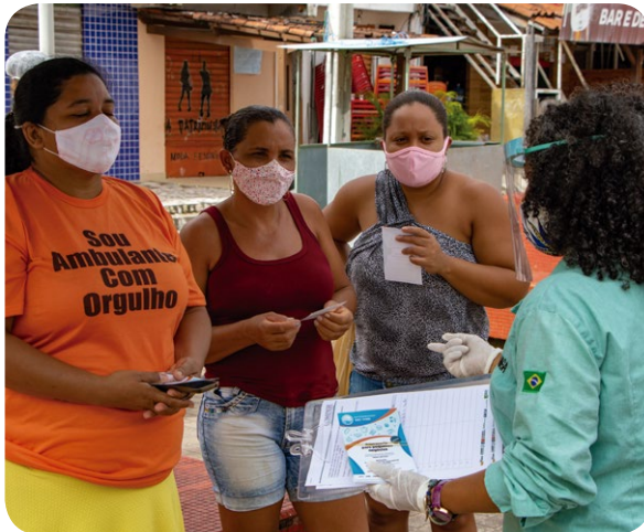
Orientação profissional em diversas áreas