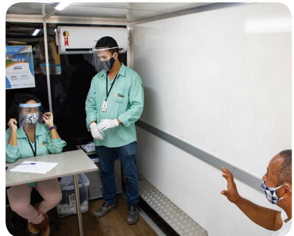
Atendimento social no escritório móvel do PTS