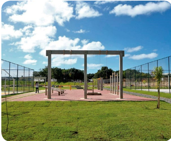
Área de lazer e convivência