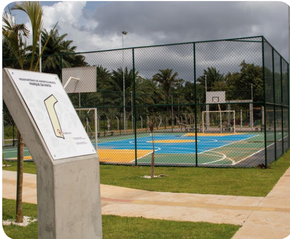
Áreas de lazer e convivência