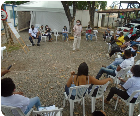
Dinâmica do facilitador com participantes da Oficina de Capacitação