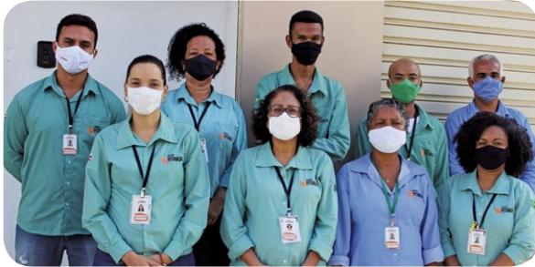
Equipe Social do Consórcio Ipitanga