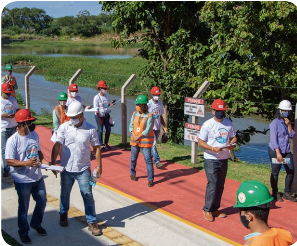
Presença das equipes do Social e de Engenharia do Consórcio Ipitanga e da CONDER