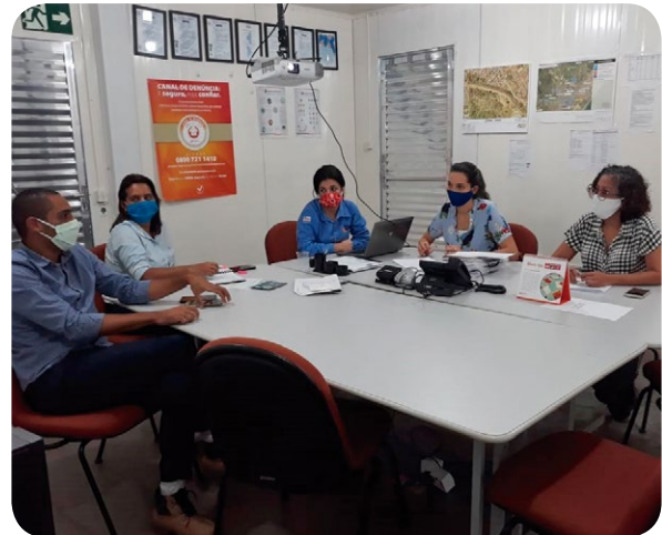
As equipes do Social e de Engenharia se reúnem periodicamente