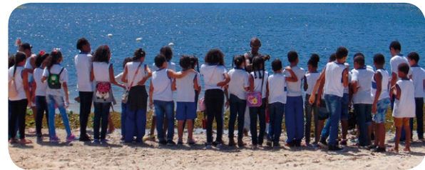
Oficina para Coleta Seletiva com estudantes da rede pública (superior à direita). Estudantes visitam Parque Metropolitano do Abaeté em Itapuã (inferior à direita)

O Coletivo de Educação Ambiental (CEA) do PTS Joanes-Ipitanga é composto por integrantes das poligonais de intervenção, que foram capacitados com o intuito de multiplicar conhecimentos e boas práticas relacionadas à conservação do patrimônio ambiental e dos recursos hídricos, localizados nas áreas de intervenção do projeto.