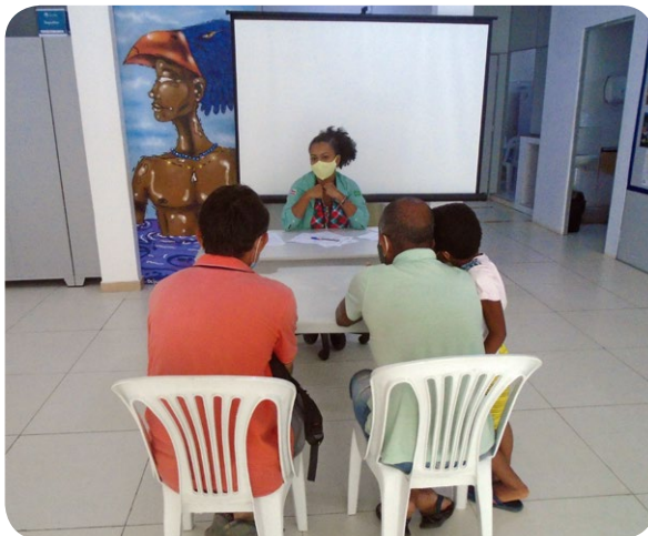
Atendimento no escritório social do PTS em Lauro de Freitas