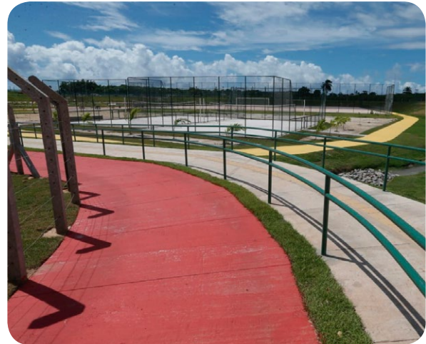
Entrada da área de lazer alagável do Parque Rosa dos Ventos

O Parque Rosa dos Ventos , localizado na entrada do bairro Jardim das Margaridas, é o primeiro equipamento de lazer entregue pela obra de macrodrenagem do Joanes-Ipitanga. O reservatório de amortecimento dispõe de urbanização, quadras poliesportivas, pistas de cooper e ciclovia, além de diminuir o impacto das enchentes na região, através da retenção da água na área de lazer alagável.