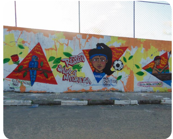
Muro grafitado pelos jovens participantes da oficina de grafite