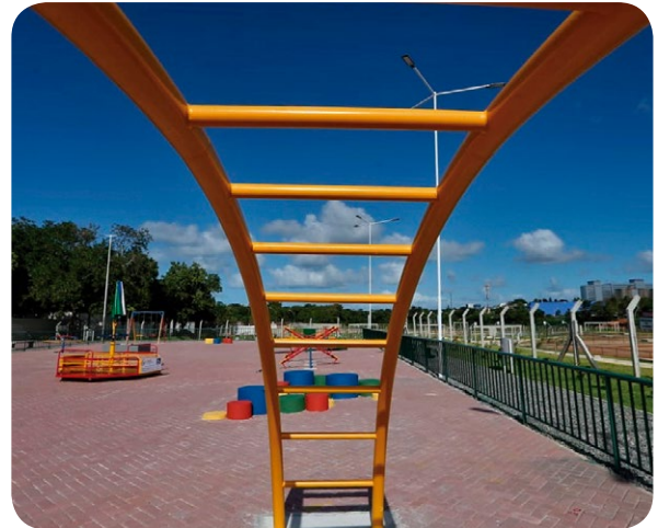
Espaço para as crianças